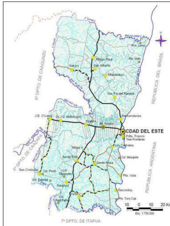
MAPA DE LA RED VIAL DE ALTO PARANÁ