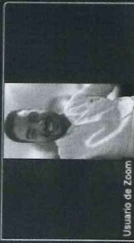
Usuario de Zoom